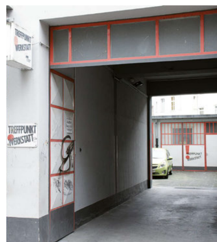
Die Einrichtung „Treffpunkt und Werkstatt“ liegt in einem Hinterhof an der Querstraße 14.

Desinfektionsmittel für die Hände wäre schön. Generell können wir Toilettenartikel, Handtücher und warme Kleidung immer gebrauchen. keh