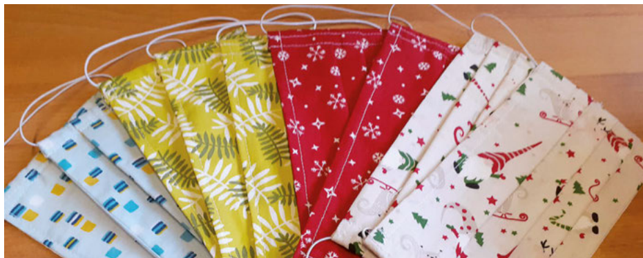
Man muss mit der Zeit gehen: (Weihnachts-) Masken mit Tannenzweigen und Sternchen.

Denn auch in diesem Jahr haben emsige Ehrenamtliche gebastelt, genäht, gestrickt, gebacken, fotografiert und mit viel Phantasie Unikate hergestellt: Selbstgestrickte Schals, Mützen und Socken, Fotokalender, Schmuck und Schutzengel werden nun in einem Pkw auf umgeklappter Rückbank weihnachtlich dekoriert und liebevoll präsentiert.