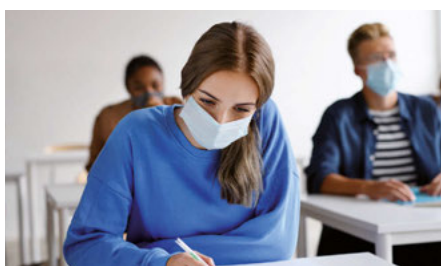
Maskenpflicht in den Sprachkursen.

Auch weiterhin Sprachkurse für Geflüchtete im Familienbildungswerk