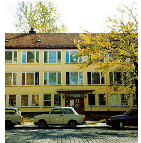
So sah die Geschäftsstelle der AWO Chemnitz 1993 aus. Vor dem Haus parkten noch Trabis. Heute ist die Geschäftsstelle in einem modernen Gebäude untergebracht.

Am 16. Mai 1990 war es dann so weit: Die AWO Chemnitz wurde gegründet. In den folgenden Wochen und Monaten delegierten wir weitere Mitarbeiter*innen, teilweise gleich für mehrere Wochen, nach Chemnitz. Ihre Aufgabe bestand unter anderem im Aufbau einer Finanzabteilung (unser Wirtschaftsplansystem wurde teilweise übernommen) sowie der Beratung zur Übernahme von Heimen, Kitas etc.